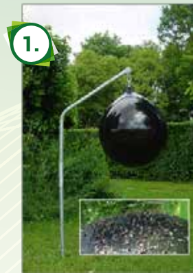
Sticky Trap Past exclusive