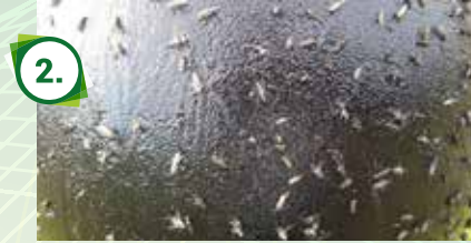
Zavěšený míč z pasti na ovády s naneseným lepidlem Sticky-Trap